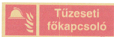
Elektromos főkapcsoló jelölése